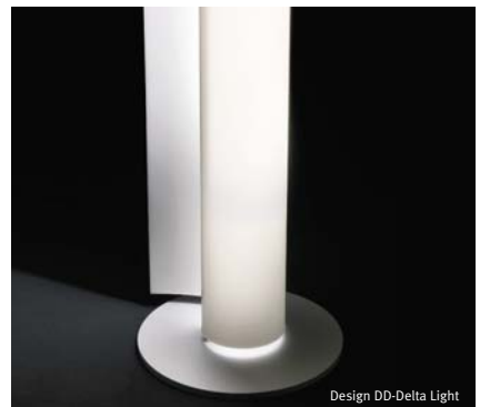
Design DD-Delta Light