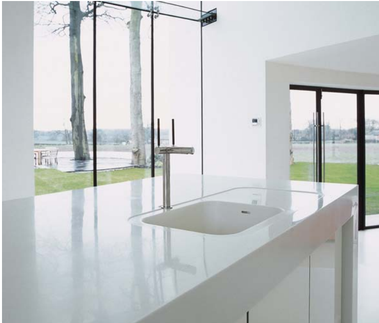
Design Ellis Williams Architects

Grâce à Corian®, la cuisine devient une affaire de goût.