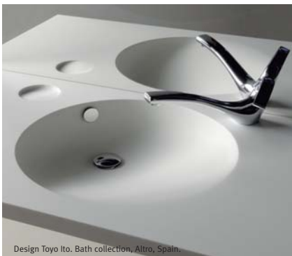
Design Toyo Ito. Bath collection, Altro, Spain.