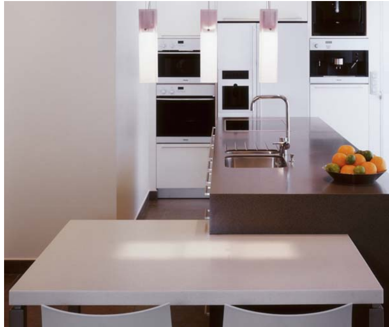
Design Sofie Lewyllie